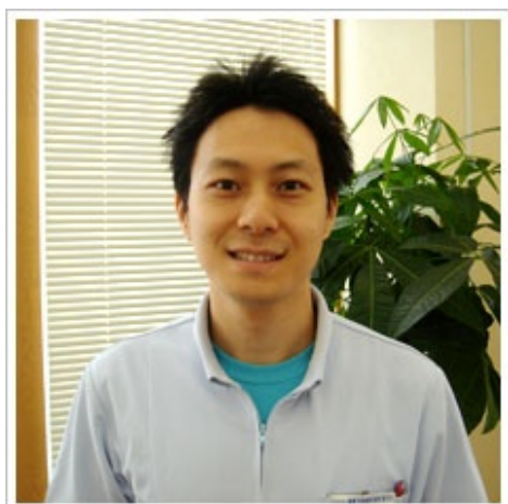
羽尾歯科医院 春日山 院長